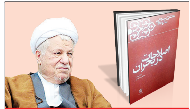
اصلاحات در بحران ۲۶م