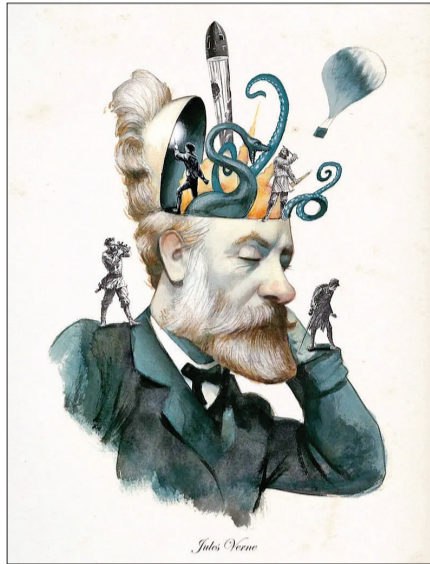
هسته‌ای ناتیلوس به افتخار کشتی افسانه‌ای به همین نام در اثر نامدار او «بیست هزار فرسنگ زیر دریا» نام‌گذاری شده است.

طور شده این خواسته او را برآورده کنند. پس همگی راهی سفری ماجراجویانه می‌شوند. سفری که به داستان‌های حماسی شبیه است. یک نقاش و یک دانشمند آماتور نیز برای یافتن پرتو سبز به آن‌ها می‌پیوندند. این گروه در سفر هیجان‌انگیز و پرمجازی خود به ساحلی دور دست می‌روند با تبادلهایی عجیب رویه‌رو می‌شوند، صبر و اراده خود را به آزمایش می‌گذارند و در نهایت، با خویشتن واقعی‌شان مواجه می‌شوند اما هر بار کسی یا چیزی، مثلاً هوای ابری، دسته‌های پرندگان یا بادبان‌های قایق‌هایی در دور دست، مانع از تحقق این خواسته می‌شوند. برای اینکه بفهمید عاقبت دوشیزه کمبل موفق به دیدن پرتو سبز می‌شود یا نه، با او و مابقی مسافران همراه شوید.