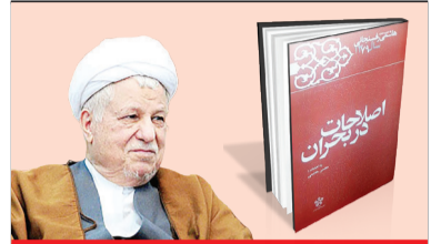
اصلاحات در بحران ۲۶۱