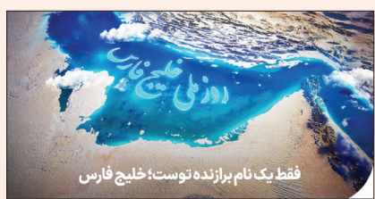
فقط یک نام براننده نوست؛ خلیج فارس

آزاد کنند. «خلیج فارس» به لحاظ وسعت، سومین خلیج بزرگ جهان و از این‌رو به دلیل موقعیت جغرافیایی خود در