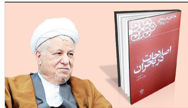
اصلاحات در بحران ۲۷۶