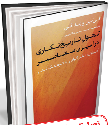
تحول تاریخ‌نگاری در ایران معاصر آموزش، ملی‌گرایی و فرهنگ نشر فرزین وجدانی، ترجمه امیرسعید الهی کتاب پارسه / ۳۳۴ صفحه / ۳۴۰۰۰۰ تومان

وجدانی به نیروهای دردم‌تیده مدرنیزاسیون، تغییرات سیاسی و اصلاحات آموزشی می‌پردازد و به خوانندگان درک جامعی از چگونگی تأثیر این پویایی‌ها بر ساخت روایت‌های تاریخی ارائه می‌دهد. کتاب دریچه‌ای به پیچیدگی‌های یک ملت در جریان