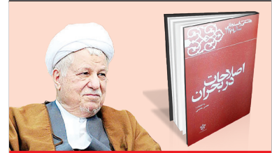
اصلاحات در بحران ۲۷۷