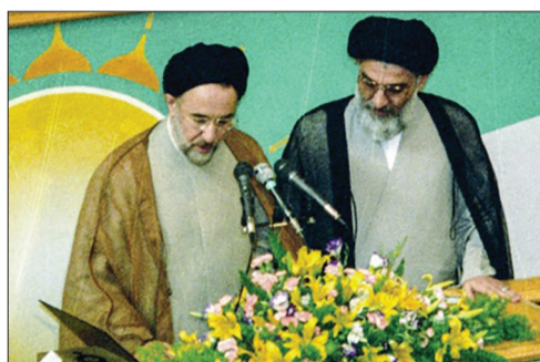
برگزاری مراسم تحلیف سیدمحمد خاتمی با حضور مقامات و خبرنگاران خارجی