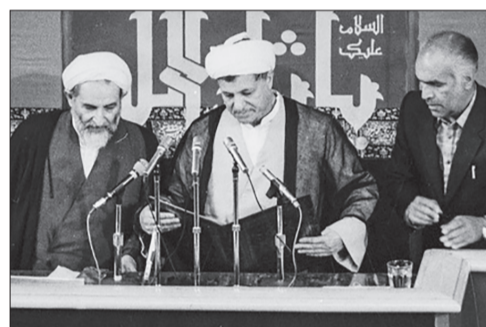
تحلیف هاشمی‌رفسنجانی با همراهی آیت‌الله یزدی نخستین رئیس قوه قضائیه ایران