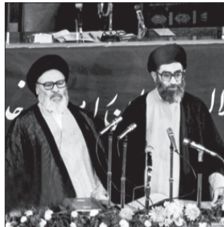
ادی سوگند آیت‌الله سیدعلی خامنه‌ای در کنار موسوی اردبیلی، رئیس شورای عالی قضایی