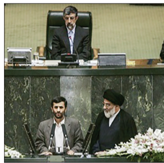
حضور رئیس دولت اصلاحات و هاشمی‌رفسنجانی در ردیف اول و در کنار محمود احمدی‌نژاد