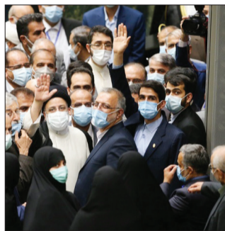
غیبت آملی‌لاریجانی، رئیس مجمع تشخیص مصلحت نظام و علی‌لاریجانی در تحلیف ریسی