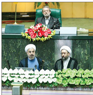
تحلیف روحانی با حضور مقامات ارشد خارجی