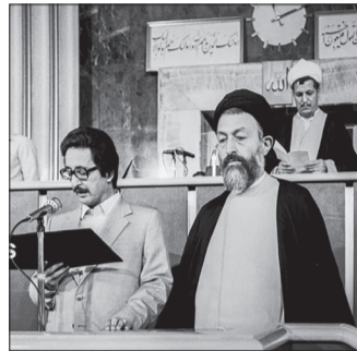
مراسم تحلیف بنی‌صدر در کنار آیت‌الله بهشتی در شرایط خاص کشور بعد از انقلاب و استعفای بازرگان