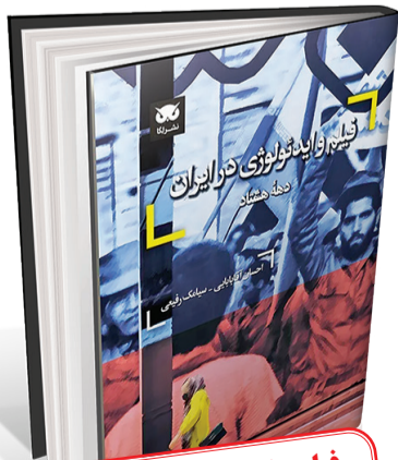
فیلم و ایدئولوژی در ایران دهه هشتاد احسان آقابابایی، سیامک رفیعی نشر لگا / ۱۴۱ صفحه / ۱۳۰۰۰۰ تومان