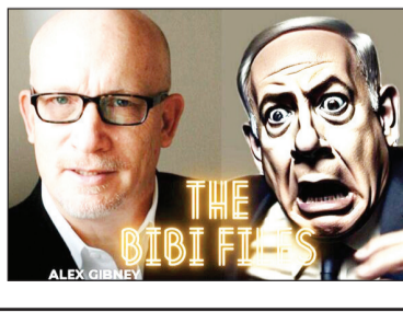
THE BIBI FILES ALEX GIBNEY