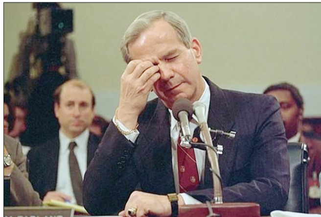
نیره خادمی گروه تاریخ

همه چیز درباره مک فارلین یا ایران‌گیت از سقوط یک هواپیمای قدیمی آمریکایی بر اثر موشک ضدهوایی در اکتبر سال ۱۹۸۶ شروع شد و تنها بازمانده‌ای که به اسارت گرفته شد. اندکی پس از اعترافات یوجین هیزنفاس درباره نقش آمریکا در تجهیز کنتراها علیه حکومت سوسیالیستی مرکزی، روزنامه لبنانی الشراع از ماموریت مخفیانه رابرت مک فارلین، مشاور امنیت ملی رونالد ریگان به تهران خبر داد اما ظاهراً اطلاعات مربوط به سفر مک فارلین را جوانانی ایرانی و عرب به نشریه داده بود. ماجرای فروش سلاح به ایران برای آزادی گروگان‌های آمریکایی در لبنان، همان زمان مطرح شد، درحالی که ایران در جنگ با عراق بود. از آن زمان تاکنون روایت‌های مختلفی درباره این واقعه وجود دارد و سازندگی در سالگرد فاش شدن ماجرای مک فارلین در ۱۲ آبان سال ۱۳۶۵ به برخی از این روایت‌ها و زوایای تاریخی پرونده پرداخته است.