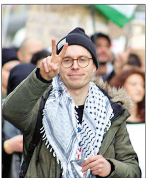
در تقاضای شما به‌صورت آنلاین خرید امکان دارد لئون ویستری خفسکی

۲۰۲۴ به هاروی اهدا شد. او گفت که قصد دارد این پول را برای خرید یک دوچرخه جدید صرف و به ژاپن سفر کند. جایزه بوکر که سال ۱۹۶۹ تأسیس شد، یکی از مهم‌ترین جوایز ادبی جهان است که هر ساله به نویسنده رمانی که به زبان انگلیسی نوشته و در بریتانیا یا ایرلند منتشر شده باشد، اعطا می‌شود. این جایزه اغلب به عنوان سنگ بنای حرفه‌ای یک نویسنده در نظر گرفته می‌شود و به طور منظم ستاره‌های ادبی جدیدی نیز معرفی می‌کند. برناردین اواربستو، داگلاس استوارت و مارلون جیمز از جمله برندگان اخیر جایزه بوکر هستند و سال گذشته پل لیتنج، نویسنده ایرلندی برای نگارش پنجمین رمان خود با عنوان «آواز پیامبر» به عنوان برنده بوکر ۲۰۲۳ انتخاب شد.