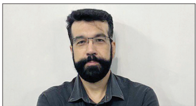
پزشک متخصص قلب و استناد دانشگاه پزشکی یاسوج