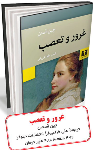
غرور و تعصب جین آستین ترجمه علی خراعی‌فر | انتشارات نیلوفر ۴۷۲ صفحه / ۴۸۰ هزار تومان

داری به شهر محل زندگی خانواده نیت می‌آیند. آقای بینگلی به جین، خواهر بزرگ‌تر الیزابت علاقمند می‌شود اما داری با او بی‌اعتنایی می‌کند. سوء تفاهم‌ها و برخورد‌های اولیه، زمینه‌ساز تنش و کینه‌ای بین الیزابت و داری می‌شود. با گذر زمان و رخداد‌های مختلف، هر دو از پیش‌داوری‌های خود دست کشیده و به تدریج شیفته یکدیگر می‌شوند. در این میان، ماجراهای عاشقانه خواهران دیگر الیزابت نیز روایت می‌شود. جین و بینگلی با وجود عشق و علاقه‌ای که به یکدیگر دارند به دلیل سوء تفاهم و دخالت اطرافیان از هم دور می‌شوند. مری، خواهر سوم با ثروتمندی متکبر و بی‌ادب ازدواج می‌کند و در نهایت لیدیسا، خواهر کوچک‌تر، با فرار از خانه و ازدواج شتاب‌زده با مردی بی‌قید و بند، آبروی خانواده را به خطر می‌اندازد. «غرور و تعصب» فراتر از یک داستان عاشقانه ساده به واکاوی مضامین عمیق اجتماعی، اخلاقی و روان‌شناختی می‌پردازد. آستین در این اثر، تصویری دقیق از جامعه طبقاتی انگلستان و نقش ثروت، موقعیت اجتماعی و جنسیت در روابط انسانی ارائه می‌دهد. «غرور و تعصب» بارها به صورت فیلم و سریال تلویزیونی اقتباس شده است که از جمله معروف‌ترین آن‌ها می‌توان به سریال ۶ قسمتی «غرور و تعصب» در سال ۱۹۹۵ به کارگردانی اندرو دیویس و با بازی جنیفر ایلی (در نقش الیزابت) و کالین فرث (در نقش داریسی) و فیلم «غرور و تعصب» (۲۰۰۵) به کارگردانی جو رایت و با بازی کیرا نایتلی (الیزابت) و متیو مک فادین (داریسی) اشاره کرد.