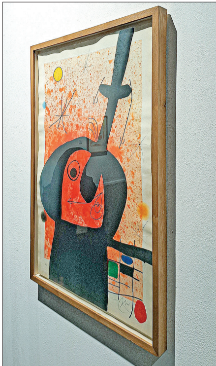
نابو متفکر توانا ۱۹۶۶ از خوان میرو؛ تاب برداشتن و اعوجاج شدید در اثر رد رطوبت بر روی شیشه که در قسمت‌های مشکی در خط میلیبی سمت راست و بالای تصویر کاملاً مشهود است. در نمای بسته‌تر از اثر هم می‌توانیم به غیر از اعوجاج ایجاد شده به دلیل رطوبت، شکستگی قاب را نیز در سمت چپ تصویر ببینیم.