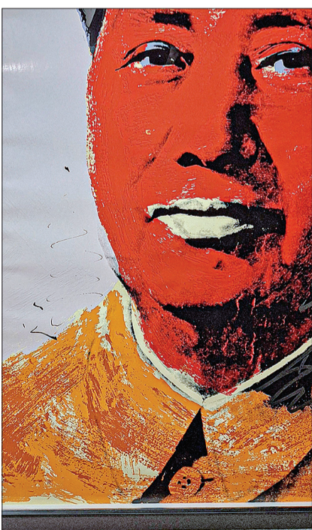
پرتره مانو و پرتره میک چکر از اندی وارهول؛ آسیب‌های جدی و اعوجاج‌های شدید در این دو اثر هم قابل مشاهده است.