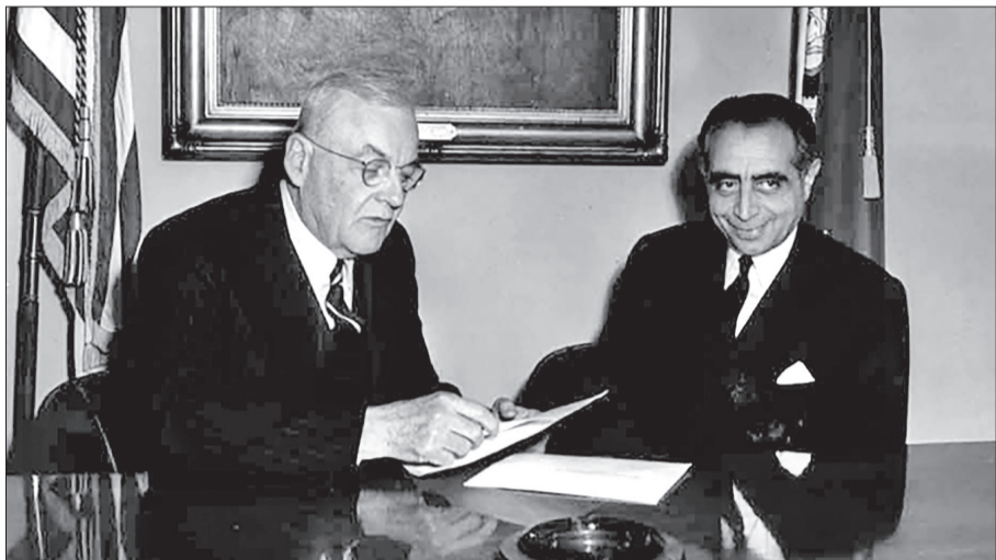
علی امینی در دیدار با جان فاستر دلس وزیر امور خارجه آمریکا/ ۱۹۵۰

مأموران آمریکایی در ایران تصویر دقیقی از فعالیت‌های مأموران آمریکایی در ایران ارائه می‌دهد