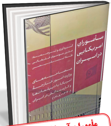
مأموران آمریکایی در ایران مصاحبه‌های وزارت امور خارجه آمریکا با دیپلمات‌ها و کارمندان در ایران (۱۳۰۸، ۱۳۴۰) گردآوری و ترجمه: علی موسوی خلخالی، طلا تسلیمی کتاب پارسه/ ۳۵۸ صفحه/ ۴۳۵ هزار تومان

بخش دیگری از کتاب به فعالیت‌های فرهنگی و آموزشی ایالات متحده در ایران در دوران پهلوی می‌پردازد. آمریکا با ایجاد نهادهایی چون انجمن ایران و آمریکا و مشارکت در تأسیس دانشگاه‌هایی نظیر دانشگاه پهلوی (دانشگاه شیراز) و دانشگاه آریامهر (دانشگاه صنعتی شریف) تلاش کرد علاوه بر ارتقای سطح آموزشی، ارزش‌های فرهنگی و سبک زندگی غربی را نیز به جامعه ایرانی منتقل کند. این اقدامات، با هدف ایجاد تغییرات اجتماعی و فرهنگی، بخشی از سیاست نفوذ آمریکا در ایران بود که به‌ویژه در دهه‌های ۴۰ و ۵۰ شمسی در حوزه‌های گوناگون