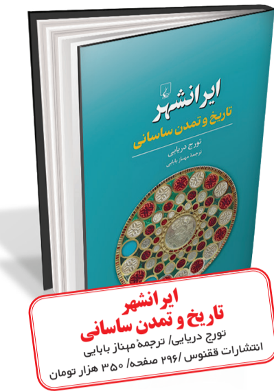
ایرانشهر تاریخ و تمدن ساسانی تورج دریایی، ترجمه مهناز بابایی انتشارات ققنوس / ۲۹۶ صفحه / ۳۵۰ هزار تومان