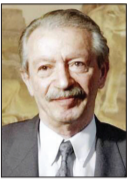
شاپور بختیار سه روز پس از آغاز سه کار خود در جایگاه نخست‌وزیر، در مصاحبه‌ای تلفنی با رادیو فرانسه که به

طور مستقیم بخش می‌شد به پرسش‌های گروهی از خبرنگاران که در تهران و پاریس مطرح می‌کردند پاسخ گفت. او در این مصاحبه ضمن آنکه کودتای نظامی در آن مقطع را بدترین راه‌حل توصیف کرد، یادآور شد که از ارتش اطمینان گرفته است و تصور نمی‌کند ارتش حرکتی در خلاف جهت مصالح ملی ایران کرده باشد. همچنین گفت که رفتن شاهه عملی انجام شده است و مهم نیست که امروز برود یا فردا؛ آنچه اهمیت دارد این است که آیا ایران تمامیت، استقلال و وحدت خود را حفظ خواهد کرد، یا نه. او در این گفت‌وگو که روز پنج‌شنبه ۲۱ دی ۵۷ در روزنامه کیهان منتشر شد در مورد جبهه ملی گفت که